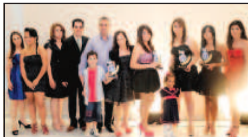
LOJA DE CALÇADOS FEMININO - MARCILENE CALÇADOS