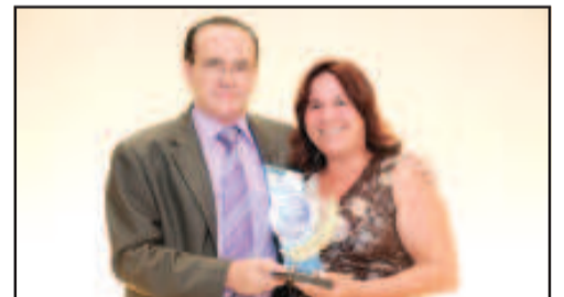
LOJA DE ROUPAS (PREÇOS POPULARES) - FAROL MAGAZINE