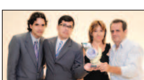
REVENDA DE PNEUS - LN PNEUS E RODAS