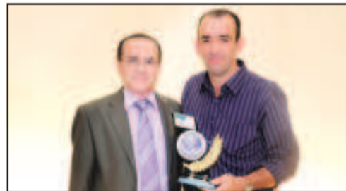
BORRACHARIA - ZEZÃO PEÇAS E ACESSÓRIOS