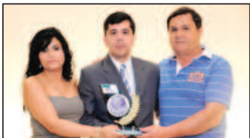
ESTRUTURA METÁLICAS - NEY ESTRUTURA METÁLICAS