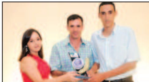
LOJA DE INFORMÁTICA - SIGMA INFORMÁTICA