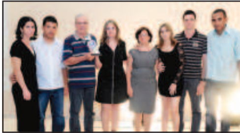
PANIFICADORA - PANIFICADORA PAULISTA