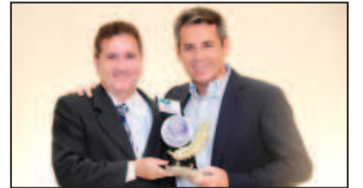
EMPRESA DO ANO - SUPER FRANGO