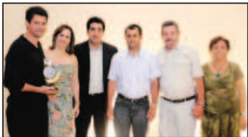
NUTRIÇÃO ANIMAL - GUIRIN - TUDO P/ AGROPECUÁRIA