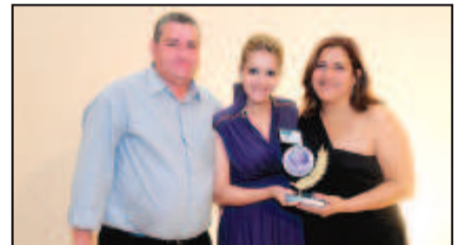
LOJA DE PRESENTES - BAZAR BESSA-DECORAÇÕES E PRESENTES