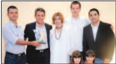
AUTO ESCOLA - AUTO ESCOLA CONEXÃO