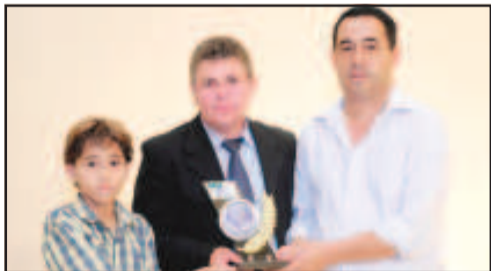
AUTO ELÉTRICA - AUTO ELÉTRICA CARLOS