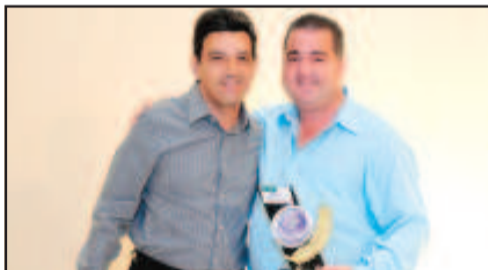
HORTIFRUTI - SUPERMERCADO RIO DAS PEDRAS