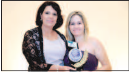
ACADEMIA - SPAÇO D

ACIAPI/CDL de Itaberaí/Goiás promoveu o tradicional evento, que é realizado anualmente, para oficializar a premiação dos lojistas que foram os mais lembrados no ano de 2010, o troféu é entregue anualmente as empresas mais lembradas em pesquisas de opinião pública.