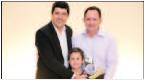
MADEIREIRA - MADEIREIRA DO GERÉ