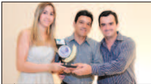
GRAFICA - GRAFICA E EDITORA ITABERAI LTDA