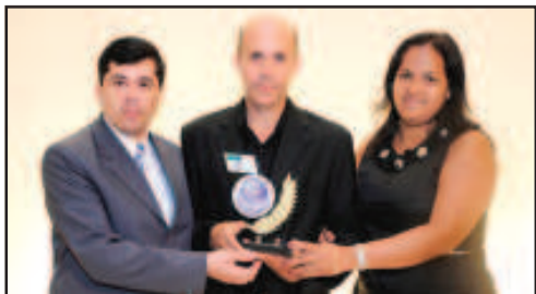
EVENTO, FESTA E DECORAÇÕES INFANTIS - JOSÉ DO EGITO E KÊNIA, EVENTOS FESTAS E DECORAÇÕES INFANTIS