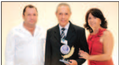
ESPAÇO PARA EVENTO - LOJA MAÇONICA VITÓRIA DA RAZÃO