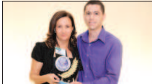
RESTAURANTE/ CHURRASCARIA - RESTAURANTE E CHURRASCARIA LIMA