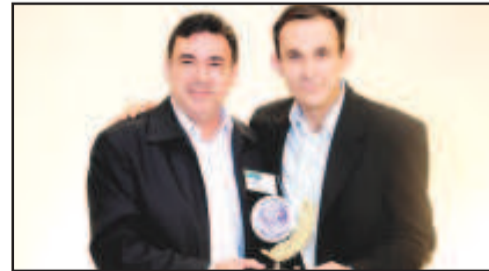
COMÉRCIO DE GRÃO - CEREAGO COMÉRCIO DE GRÃOS E RAÇÕES