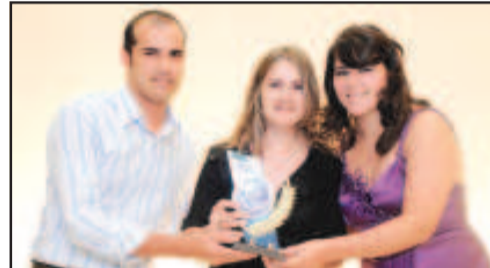
AUTO PEÇAS PARA MOTO - MOTO UNIÃO