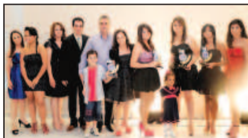
LOJA DE CALÇADOS INFANTIL - MARCILENE CALÇADOS