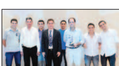
REVENDA DE PRODUTOS AGRÍCOLAS - AGRODAN