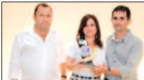
PIZZARIA - COLUCCI PIZZARIA