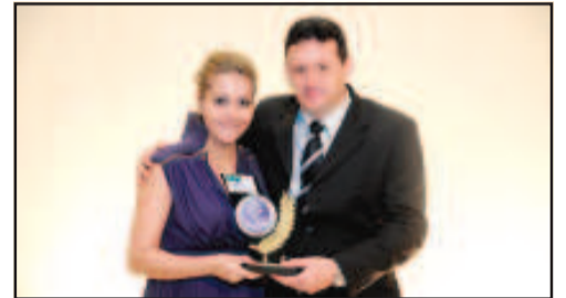
LOJA DE MÓVEIS E ELETRODOMÉSTICOS - MOVÉIS ESTRELA