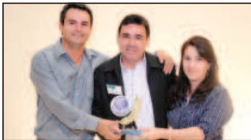
PERSIANAS E DECORAÇÃO - ESPAÇO DECORAÇÃO CORTINAS E PERSIANAS