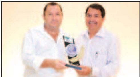
ESCOLA PARTICULAR - INSTITUTO DE EDUCAÇÃO ALIANÇA