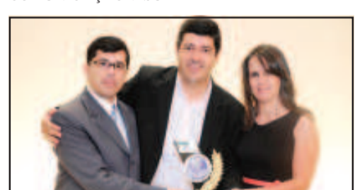
SISTEMA PARA COMPUTADORES (AUTOMAÇÃO COMERCIAL) - SIGMA INFORMÁTICA