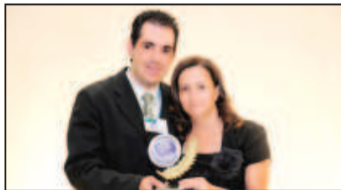
LOJA DE CALÇADOS EM GERAL - MARCILENE CALÇADOS