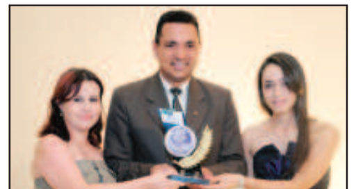
LOJA DE ROUPAS INFANTIS - COMPANIA KIDS-PUC