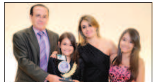
LOJA DE ROUPAS EM GERAL, CAMA, MESA, E BANHO - MERCADÃO DA MODA