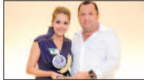
CLÍNICA ODONTOLÓGICA - CENTRO CLÍNICO PRÓ SORRIR