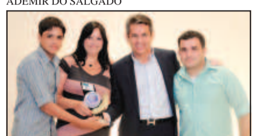
SEGURANÇA ELETRÔNICA - JOTEC SISTEMAS ELETRÔNICOS