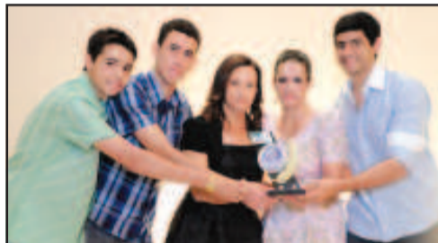
REVEDA ESPECIALIZADA EM BICICLETAS - SPORT BIKE