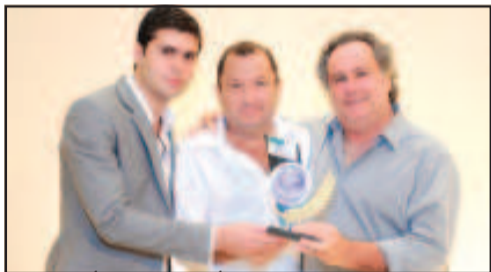
ESCRITÓRIO CONTÁBIL - GRAN CONTABILIDADE