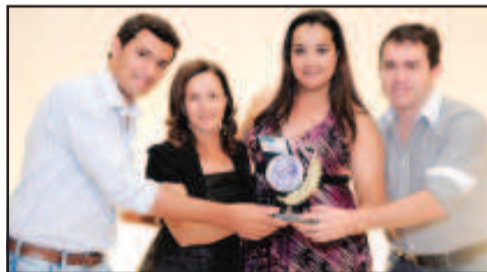
REVENDA DE CELULARES - INTERAÇÃO PAPELARIA E CELULARES REVENDA AUTORIZADA VIVO