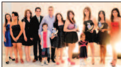
LOJA DE CALÇADOS MASCULINO - MARCILENE CALÇADOS