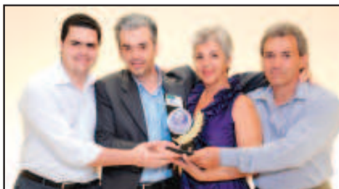
INTERNET VIA RÁDIO - ORACLON