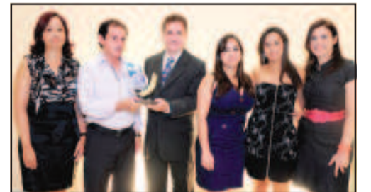
DISTRIBUIDORA DE COSMÉTICOS - REALCE- DISTRIBUIDORA DE COSMÉTICOS