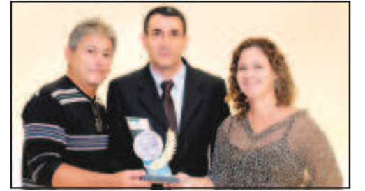
CURSO DE LÍNGUAS - FISK CENTRO DE ENSINO

A solenidade aconteceu no dia 15 de abril e foi realizada no Salão da Maçonaria Vitória da Razão às 20h: 00min foram entregues as empresas e personalidades 102(cento e dois) troféus: OS MAIS LEMBRADOS 2010.