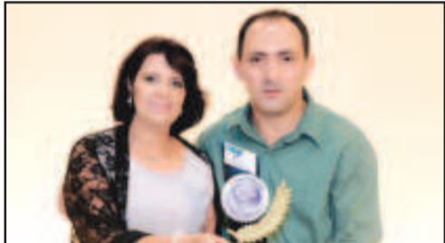
AÇOUGUE/ CASA DE CARNE - SUPERMERCADO RIO DAS PEDRAS