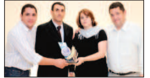
CURSO PROFISSIONALIZANTES - PREPARA