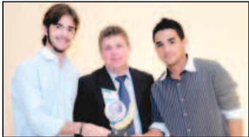
ASSISTÊNCIA TÉCNICA EM COMPUTADORES - SIGMA INFORMÁTICA