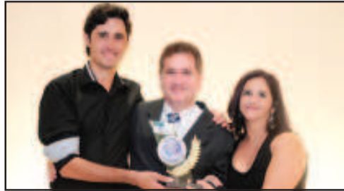
RÁDIO - RÁDIO CULTURA FM