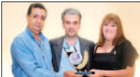
JORNAL - O ESPAÇO