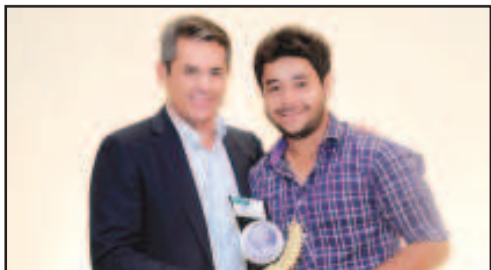
AUTO PEÇAS PARA CAMINHÕES - AUTO PEÇAS E MECÂNICA MORAIS