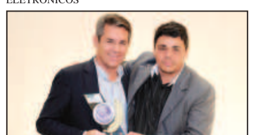
SERIGRAFIA E PLOTAGEM - ARTE COR COMUNICAÇÃO VISUAL