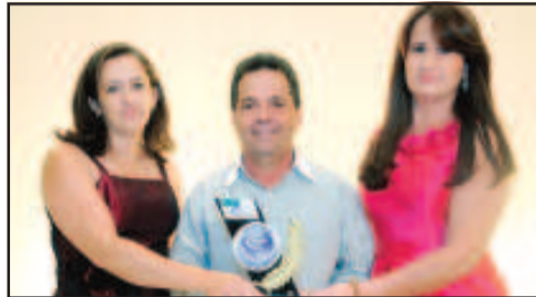
LOCAÇÃO DE TRAJES PARA FESTA E EVENTOS - MARIAH