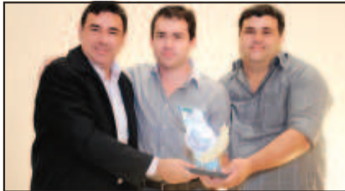
PAPELARIA - INTERAÇÃO PAPELARIA E CELULARES