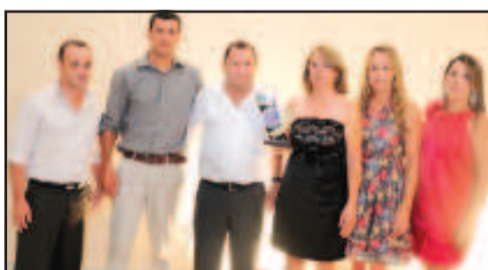
POSTO DE COMBUSTÍVEL - POSTO DE COMBUSTÍVEL AVENIDA