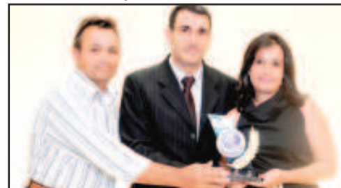
CONFECÇÃO DE MODA ÍNTIMA - DELLYRIUS CONFECÇÕES DE MODA ÍNTIMA