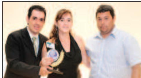
LOCAÇÃO DE TRAJES PARA NOIVAS - CINTIA NOIVAS