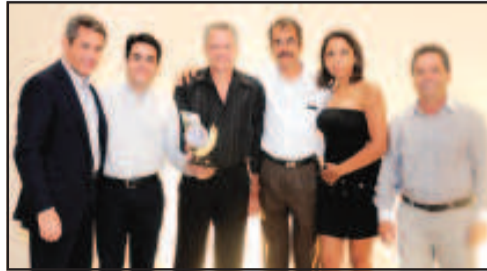
LATICÍNIO - CITALE BRASIL - PRODUTOS COPO-DE-LEITE