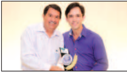
FARMÁCIA E DROGARIA - DROGARIA LIMA