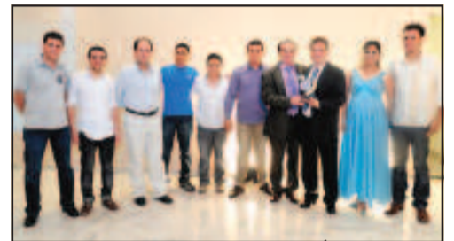
LOJA DE PRODUTOS AGROPECUARIOS - AGRODAN