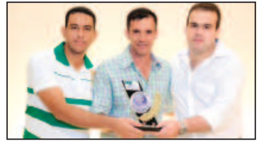
LOJA DE MATERIAIS PARA CONSTRUÇÃO - RATINHO MATERIAIS P/CONSTRUÇÃO