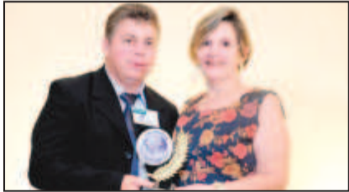
AGÊNCIA BANCÁRIA - CAIXA ECONÔMICA FEDERAL AGÊNCIA ITABERAÍ