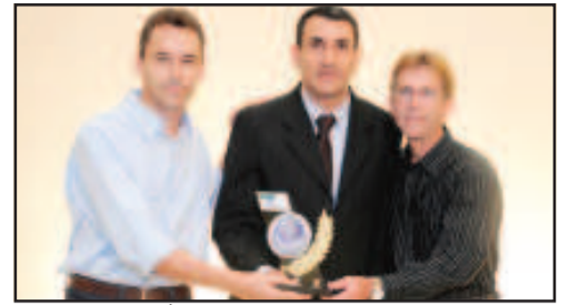
REVENDA MÁQUINAS, IMPLEMENTOS AGRÍCOLAS PEÇAS E SERVIÇOS - SOMAFERTIL