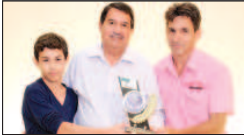
FILMAGEM - VIL VÍDEO FILMAGENS