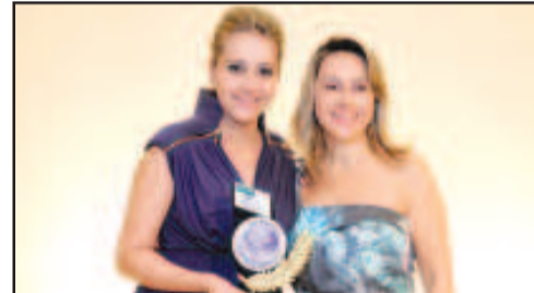
CLÍNICA MÉDICA - VIVER ESPAÇO SAÚDE