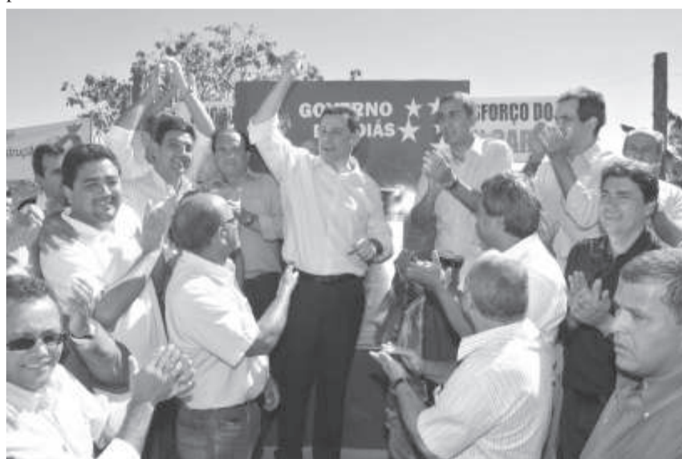
Governador e aplaudido pelos presentes