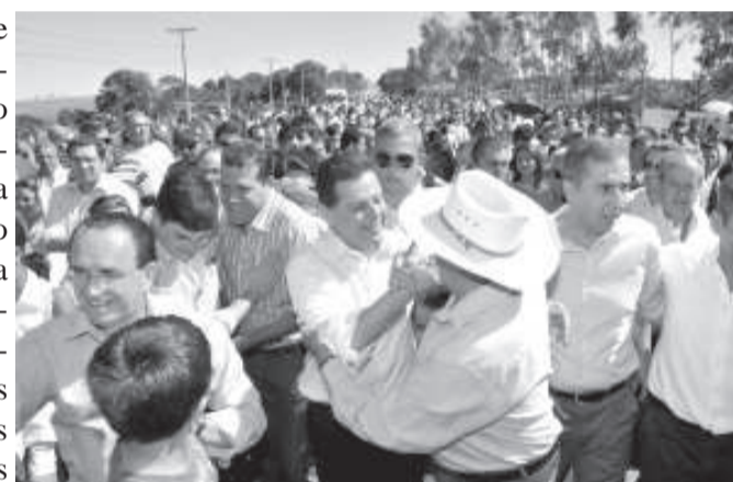
Multidão cumprimenta o governador

Marconi discursa na inauguração da que a nova rodovia de pista dupla será completamente iluminada. Segundo o governador, ficou acertado com o presidente da Agetop, Jayme Rincon, o próximo dia 27 como data para a finalização da licitação com vista à recuperação de 4.800 quilômetros de rodovias estaduais. As obras serão realizadas nos próximos dois anos.