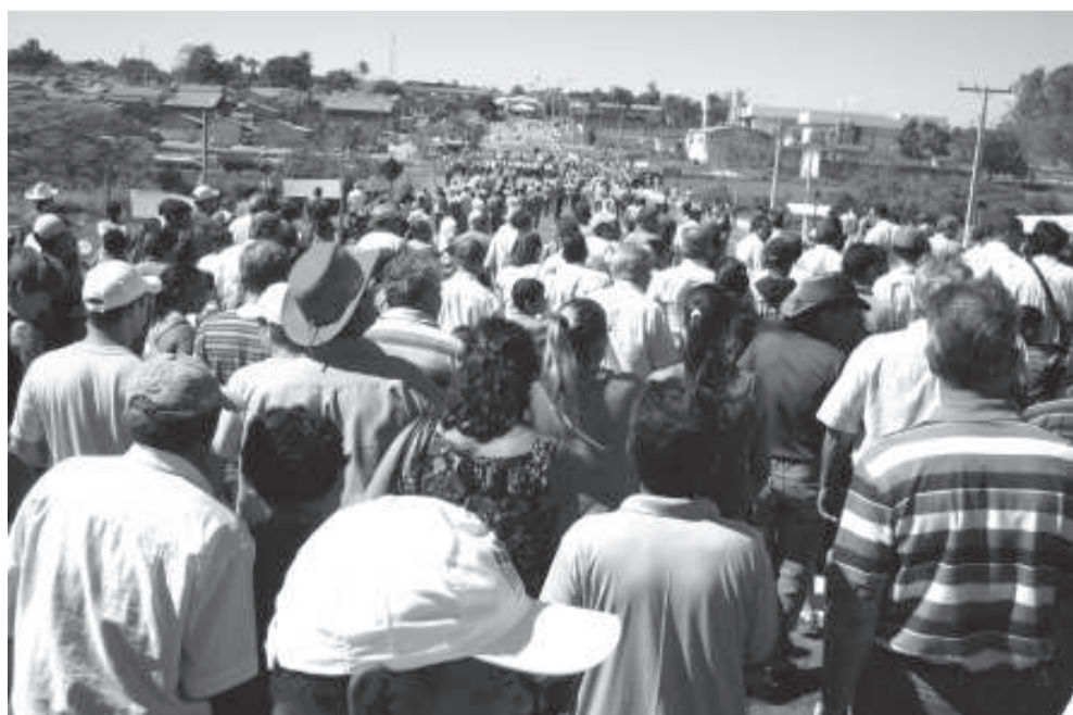
5 mil pessoas estiveram presentes