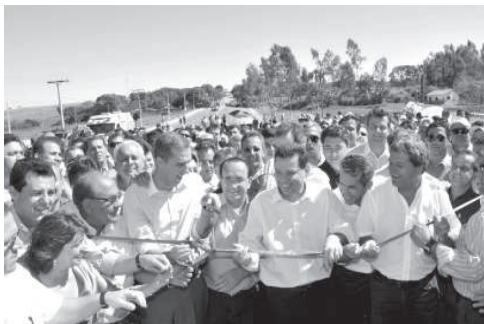
Autoridades no corte da fita