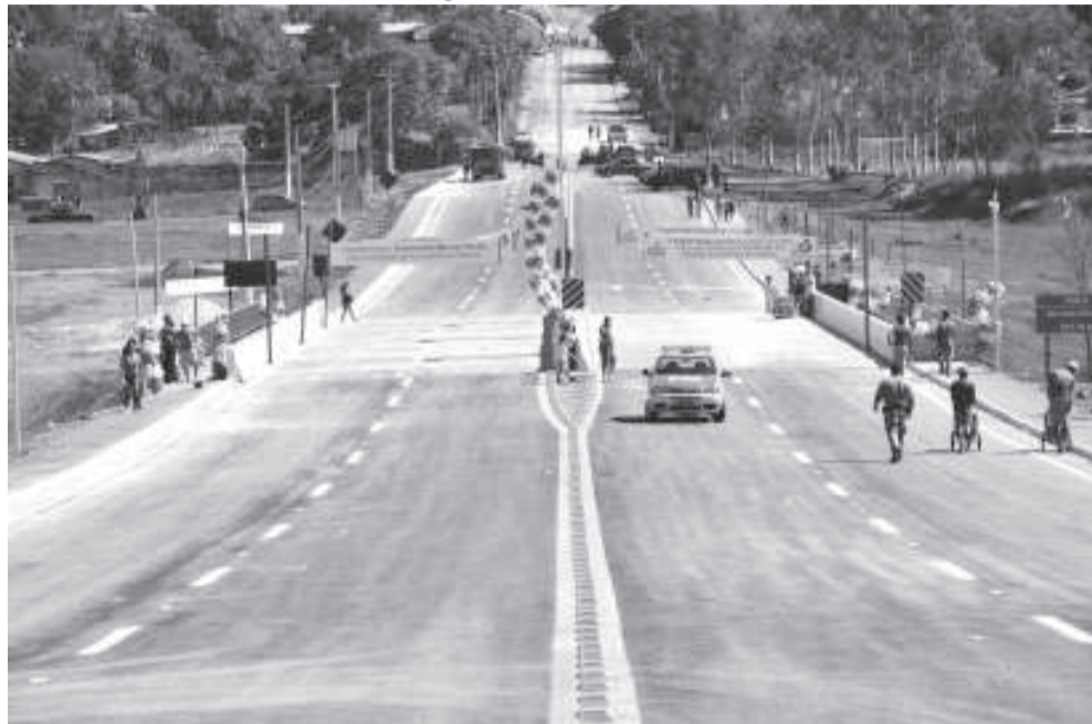
Nova ponte duplicada